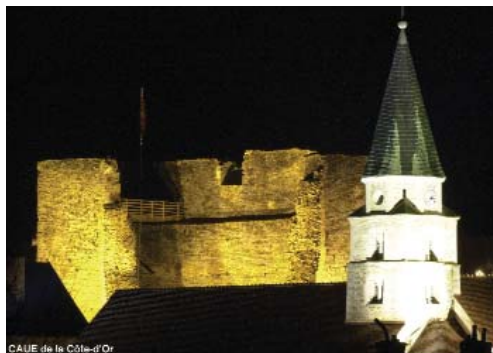
CAUE de la Côte-d'Or